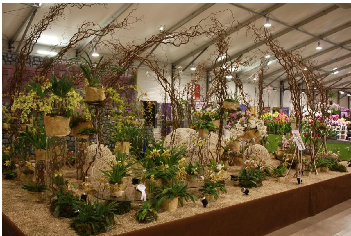
Stand des Serres du Sénat, Exposition de l'EOCCE 2018, ©Michel Le Roy

Aujourd'hui, la collection comprend 10 000 pots d'orchidées répartis en 150 genres botaniques ou inter-génériques, soit 700 espèces ou variétés réparties dans 7 chapelles dotées d'un climat spécifique, allant du froid (13°C la nuit ; 14°C le jour) au chaud (20°C la nuit ; 25°C le jour). La gestion des différents climats (température, hygrométrie, aération et ombrage) est assurée par un ordinateur relié à une station météorologique. Depuis 1883, le jardin du Luxembourg crée des hybrides d'orchidées. La collection de Paphiopedilum, et celle des orchidées de Guyane, sont reconnues collections nationales par le CCVS (Conservatoire des Collections Végétales Spécialisées).