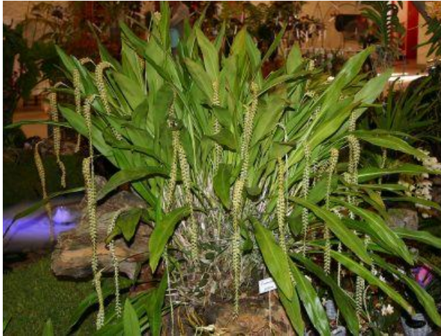
Dendrochilum filiformis , présenté par Reinhart Orchideeën, Champion de l'exposition, Gretz-Armainvilliers 2012