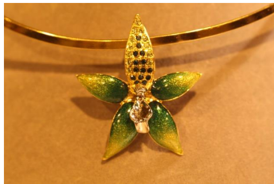
De véritables fleurs d'orchidées sont transformées en bijoux par Valérie LAVAULT

Site Internet : https://www.bijoux-lavault.com/fr/