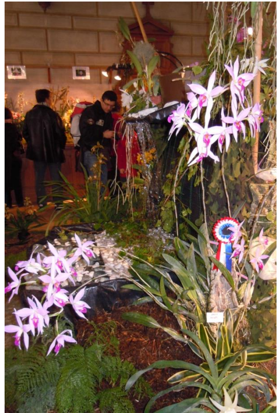
Laelia anceps , présenté par AM Orchidées, Champion de l'exposition, Paris 2012

Un jugement sera réalisé par l'Ecole des Juges d'Orchidées (EJO) de la Société Nationale d'Horticulture de France (SNHF).