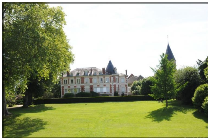
La mairie et son parc

Toute la richesse d'une histoire qui fait partager l'ambiance éternelle d'une ville de province où l'on prend le temps de vivre.