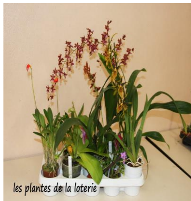
les plantes de la loterie