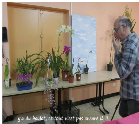
y'a du boulot, et tout n'est pas encore là !!