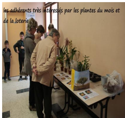
les adhérents très intéressés par les plantes du mois et de la loterie