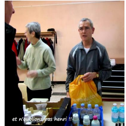
et n'oublions pas henri !!