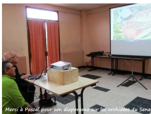
Merci à Pascal pour son diaporama sur les orchidées du Senat