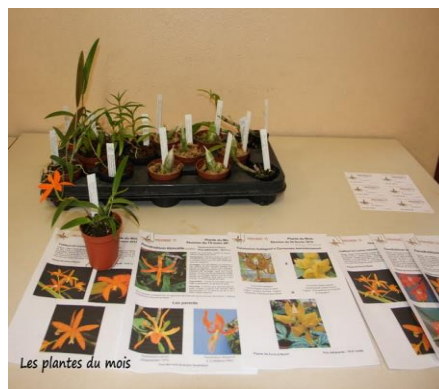
Les plantes du mois